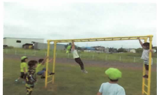
★「私だってできる！」 「ガンバレ～！」