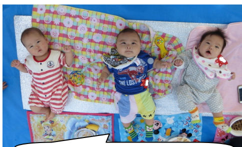
体験学習デビューしました！