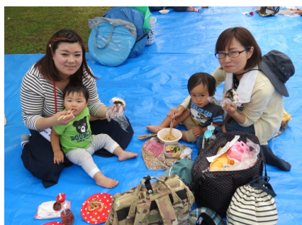
いっぱい食べたよ！