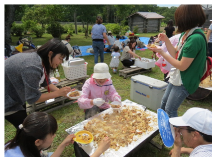
おいしく焼けてますよ〜。