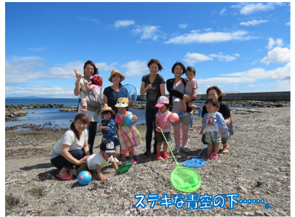
ステキな青空の下……

今回は特に、遊びからご飯や帰りの支度への切り替えが、とっても上手になっているのを感じました。それぞれが十分満たされていたからなのでしょうね。