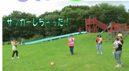
サッカーしちゃった!