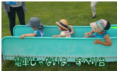
電車じゃないよ、すべり台