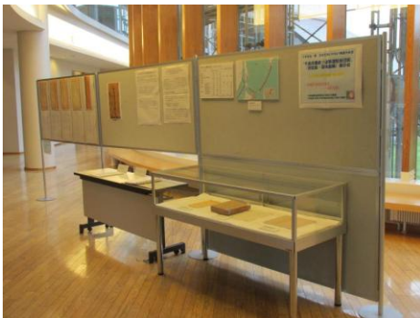
根室市内で実施した 展示会の様子