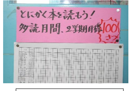
多読の取り組み(6の1)