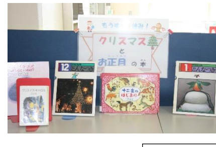
時期に応じた図書室掲示