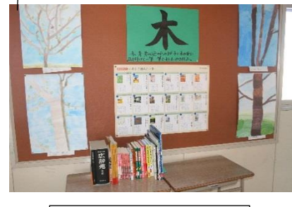
各学年廊下の図書