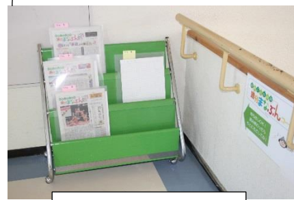
デッドスペースを活用した新聞掲示