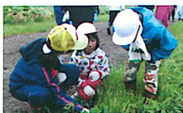
上の学年が1年生にとり方を教えています。

そして、6月9日(木)には、「 すずらん摘み・贈呈 」がありました。40年以上続くこの伝統行事には「郷土を愛する心と感謝の心」が凝縮されています。子ども達は4つの縦割り班ですずらん摘み・花束作りを行いました。すずらん摘みでは、見つけ方や切り方にもコツがあり「ここにあったよ～！」と草の中から探し当てていました。また、花束は数を数えながら放射状にうまく束ねていました。高学年が下の子ども達にやさしく丁寧に教え「さすが5・6年生！」と言う感じです。その後、学年ごとに感謝状を添えて贈呈に行きました。町長さん、教育長さん、図書館、給食センター、柏の実学園、上風連地域センター、睦クラブ、郵便局、バスの運転手さん等々。様々な方々のお陰で今の幸せがあることに気づくことのできる行事でした。これからも皆さんとのつながりを大切に、そして上風連小学校の伝統を大切に守り育てていきます。