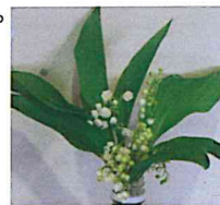
こんな素敵な花束が出来上がりました。