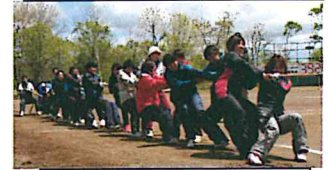
青空の下で、保護者の皆さんの力強いなびき！

さて、学校では運動会に続き「 体力テスト 」に挑戦しています。握力、50m走、ソフトボール投げ、立ち幅とび、反復横とび、上体起こし、長座体前屈、20mシャトルランの8種目を学年ごとに測定します。昨年度の結果から、本校の特徴として全国と比べて全体的に良い結果となっていますが柔軟性や敏捷性が課題とされています。今年は子ども達一人ひとりが目標を持って取り組んでいます。普段の体育の授業だけでなく、家での遊びやお手伝い、毎日の過ごし方、少年団でも体力作りができます。これから気候も温かくなり外遊びもできます。ぜひ家族みんなで意識してみてください。