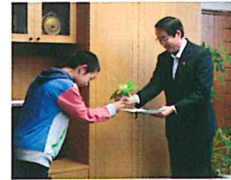
町長室や教育長室へ感謝状を添えてすずらんの贈呈です。

6月17日(金)には「 全校バス遠足 」がありました。目的地のネイパル厚岸では愛冠岬までの散策を予定していましたが、雨のため森林センターでの「木のオブジェ」作りとなりました。金づち・釘、電動ドリルやペンチ、糸のこ、クレーガンを使って貴重な体験ができました。子ども達は夢中になって作品作りができました。