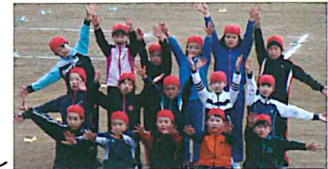
5・6年生の心を合わせた最後のポーズです。

運動会は 、天候その他を考慮し前日からの延期判断となりましたが6月5日(日)はお陰様で青空にも恵まれ、涼しいながらも子ども達が力いっぱい練習の成果を発揮できる運動会となりました。保護者地域の皆様には、急な対応をしていただき誠にありがとうございました。運動会はテーマ「Smile (スマイル) ～協力・挑戦・進化～」の下で、小中共に協力して自分自身の目標に挑戦し、子ども達がぐんぐん成長していく様子が見られたものでした。低・中・高学年の遊戯や組体操では、それぞれの発達段階に合った表現ができました。お互いの頑張りを涙しながら喜び合っている姿も素晴らしかったです。本当に心から「やった！」と笑顔になれる運動会になりました。保護者・地域の皆さん、たくさんのご声援ありがとうございました。