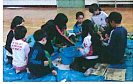
体育館で縦割り班ごとに花束を作ります。