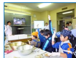
↑地域人材を活用した 授業「ホタテの解剖」