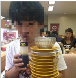
しょう油差しに口をつけた画像を投稿