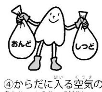
④からだに入る空気の温度や湿度を調整する

鼻は、顔の真ん中でいつも存在感抜群です。 呼吸の時に空気の通り道だとか、においをかぐ「という役割は知っているも、それ以外の働きは案外知らないのでは？ 鼻は、見えている部分だけではなく、顔の奥の方にも広がり、上記のような働きをしています。