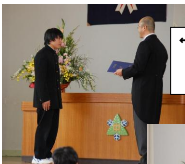
←<卒業証書授与> 義務教育の 課程を修了