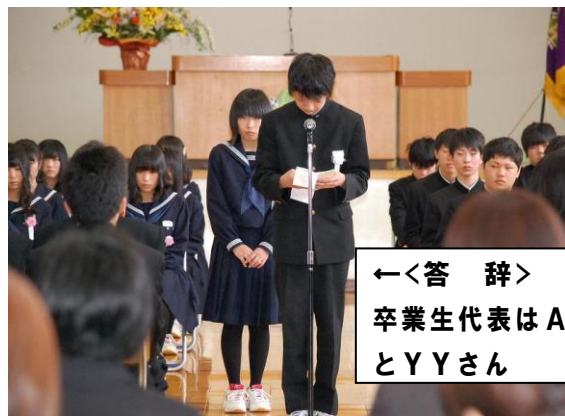
←<答 辞> 卒業生代表はAR君 とYYさん