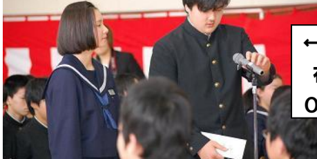
←<送 辞> 在校生の代表は OK君、OIさん