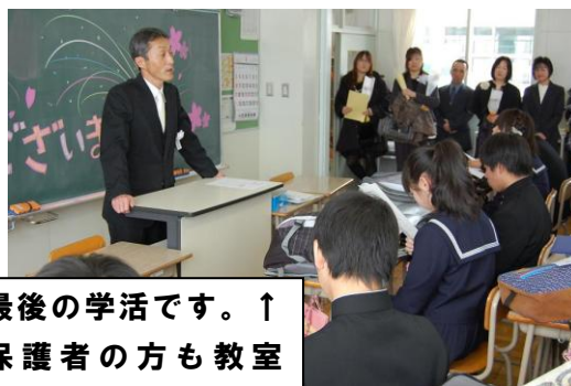
最後の学活です。↑ 保護者の方も教室 に入りました。