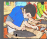
佐 亜 君