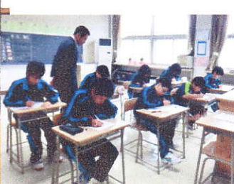
スキルアップタイム

1年生も給食の準備もテキパキと出来ているようです。今年から全校給食を火・木にそれ以外は教室給食に取り組んでいます。準備や給食の様子について、本日配布される食育だよりで紹介されていますので、ご覧下さい。