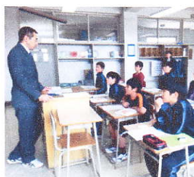
初めの従業の様子