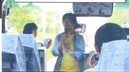
バスの中でもおもてなし係の生徒がバスガイドさんと連携をとって楽しく過ごさせてくれました。