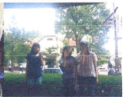
2日目は小樽でオルゴールを作って札幌で自主研修。夜は藻岩山の夜景を見に出かけました。色々大変でした