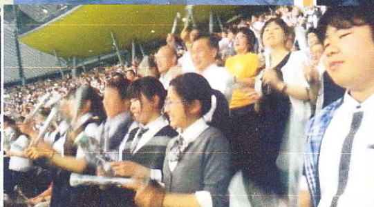
みんなで稲葉ジャンプを