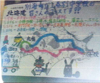
バスの3泊4日のコース図。ガイドさんも運転手さんも昨年と一緒に、去年の話をしながら本当に生徒と仲良く楽しく過ごしてくれました。