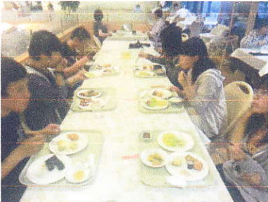
食事はどこも大変おいしく、生徒もしっかりと食べていました。毎晩反省会もみっちり・・・