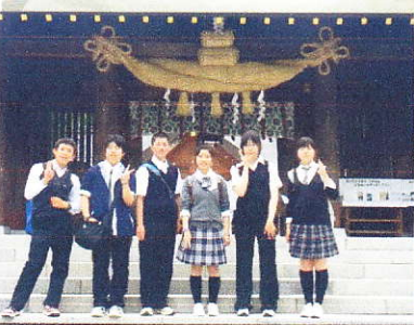
3日目は上級学校の訪問をしてから北海道神宮と白い恋人パークを見学して夜は札幌ドームへ