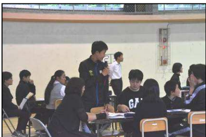
【生徒グループの代表から発表】