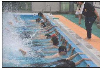
【昨年度の水泳学習】

お忙しい中とは存じますが、子どもたちの安全な体力づくり等に向け、ご協力をお願いします。