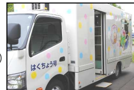
【概ね2週に一度来校する「白鳥号」】

一人一人の可能性が、本との出会いを通して広がることを願っています。【あっという間に時間が過ぎた全校読書】 【所狭しと図書を探す生徒】