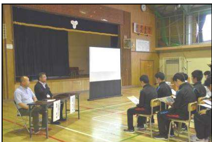
【お二人の講師をお招きしました】

保護者の皆様にも、お忙しい中、たくさん足をお運びいただきました。ありがとうございました。2学期もよろしく願いいたします！