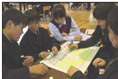
【付箋紙にアイデアを記入】