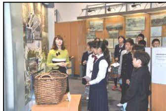
【センター内で説明を受ける1年生】

7月4日、「北方少年少女塾」として、北方四島交流センターに到着した1年生は、元島民の方から、ソ連軍が学校へやって来た時のことや島を脱出し、樺太へ行った時のことなど、当時の様子を伺いました。「北方領土が返還されたら、ま