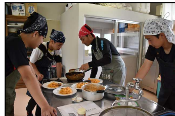
【美味しいパスタとともにいただきました!】