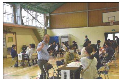
【講師（CS委員長）と保護者の皆様との協議】