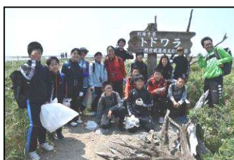
【トドワラにてハイ、チーズ!】

また、7月9日、「野付半島学習」として、1年生は尾岱沼港から観光船に乗って野付半島へ向かい、まずは、たくさんのアザラシとご対面。その後、トドワラ棧橋へと向かい、ガイドさんの素敵な案内の下、ゴミを拾いながら散策。生徒の皆さんから「色々な花やトドワラの木などが