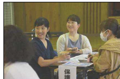
【保護者の皆様の貴重なご意見に感謝】