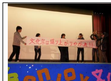
オープニングセレモニー

去る10月24日(日)に第48回文化祭が開催されました。今年の文化祭は、インフルエンザの全町的な流行、感染がなく、全員が健康で実施、終了することができました。内容は展示部門、ステージ部門に分かれて実施しました。展示では学級展示、教科展示、ステージは全校合唱、全校器楽、演劇、弁論、職員有志さらに生徒有志バンドなど盛りだくさんの内容でした。今年の文化祭、51名の生徒は、一致団結してさまざまな場面で素晴らしい頑張りを見せてくれました。全校生徒が51名の規模なので文化祭の取り組みは一人一人が何役もの役割をこなす必要があります。限られた期間、時間で準備は大変です。その中で、各生徒が底力を発揮してそれぞれの任務、仕事を責任もってやり抜いてくれました。生徒たちの頑張りにより、私達教職員も元気・エネルギーをもらいました。また、今年の文化祭テーマ「Let's enjoy 文化祭」の通り、全員で文化祭を盛り上げて楽しみましようということが一番の目標に取り組みました。終了した時に、生徒皆が、充実感を、達成感を味わうことができたと思います。これはとても重要であり、今後も、この文化祭から得たものを糧にして指導、努力をしていきたいと考えます。