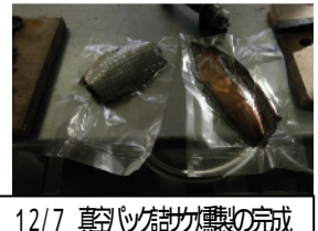
12/7 真空パック餃子製の完成